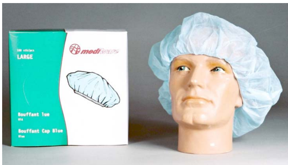
Art.nr. 610260 HETTE, ENGANGS, BLÅ M/STRIKK Nonwoven