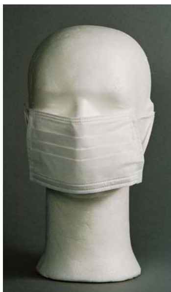
Art.nr. 610340 MUNNBIND Kartong m/50 stk.