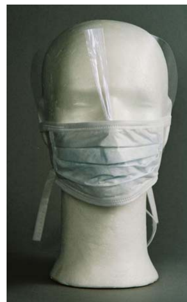
Art.nr. 610350 MUNNBIND M/VISIR